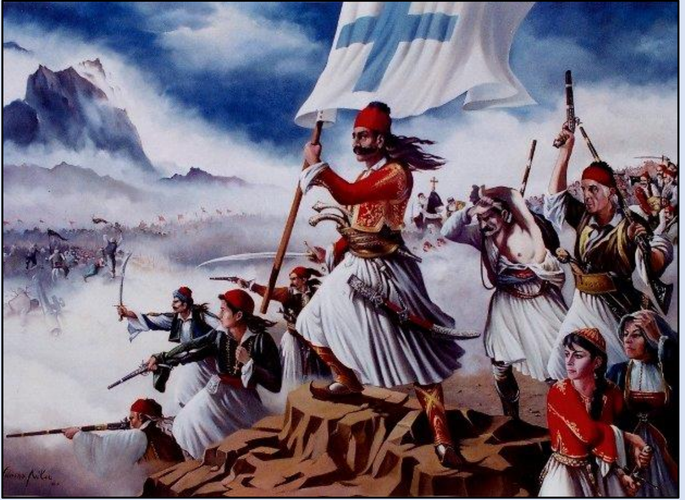
Εικόνα 1: Ο Καραϊσκάκης στη μάχη της Αράχωβας.