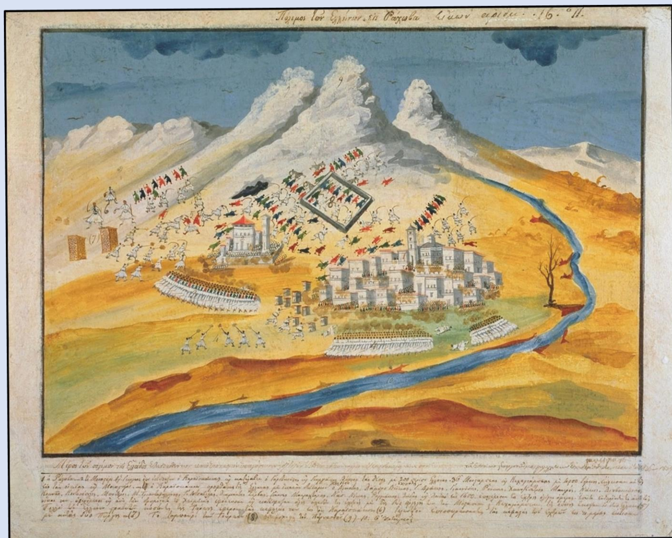
Εικόνα 8: Μάχη Ράχωβας, περιγραφή Μακρυγιάννη, απεικόνιση Π. Ζωγράφου.

δύναμη των 1.500 Τουρκαλβανών και Τουρκομακεδόνων κατατροπώθηκε από τους 300 Σουλιώτες του Διαμάντη Ζέρβα και του Λάμπρου Ζάρμπα. Στην κυριολεξία οι Σουλιώτες κατέσφαξαν τις ενισχύσεις του Κιουταχή. 100 νεκροί και 80 υποζύγια με τρόφιμα και πυρομαχικά, που έπεσαν σε ελληνικά χέρια, ήταν οι απώλειες των Τούρκων. Οι υπόλοιποι, τράπηκαν σε άτακτη φυγή. Μόλις πληροφορήθηκε αυτή την εξέλιξη ο Μουσταφά μπέης, ζήτησε να συνθηκολογήσει.