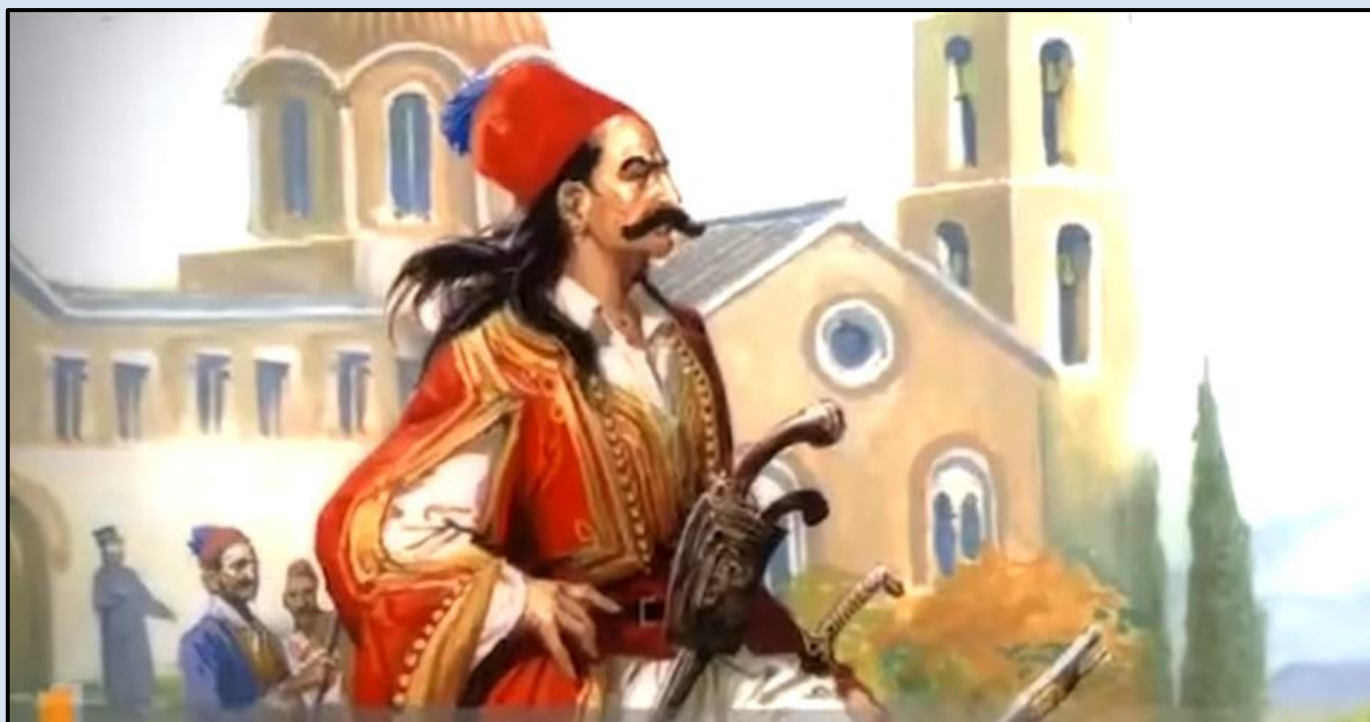
Εικόνα 9: Ο Γεώργιος Καραϊσκάκης.

Και πάλι όμως οι διαπραγματεύσεις δεν προχωρούσαν, καθώς οι Έλληνες ζητούσαν και την παράδοση των Σαλώνων και της Λιβαδειάς. Γύρω στις 01.00, ο καιρός επιδεινώθηκε περισσότερο. Φυσούσαν παγωμένοι άνεμοι και χιόνιζε ασταμάτητα. Περίπου στις 04.00, ενώ οι περισσότεροι Έλληνες ζεστάνονταν στα σπίτια της Αράχωβας, 700 Γκέκηδες, χωρίς να ενημερώσουν τους υπόλοιπους, ξεκίνησαν να φεύγουν άτακτα, προκαλώντας σύγχυση και ταραχή στο στρατόπεδο των Τουρκαλβανών. Βλέποντας όλα αυτά, οι Έλληνες άρχισαν να καταδιώκουν με μανία τους φυγάδες. Το μπαρούτι τους είχε βραχεί από το χιόνι και είχε αχρηστεύσει τα όπλα τους, έτσι άρχισαν να τους