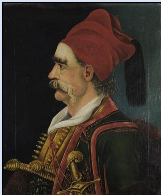
Εικόνα 7: Διαμάντης Ζέρβας, ελαιογραφία σε μουσαμά του Ι. Κάσκαρη, Ναύπλιο, 1844.

Οι άνδρες του Καραϊσκάκη, έδιωξαν τους 50 ιππείς από το ύψωμα Καϊμένος Σταυρός και τους ανάγκασαν να καταφύγουν στην οχυρωμένη τοποθεσία του Μουσταφάμπεη. Καθώς προχωρούσαν όμως οι Έλληνες, δέχτηκαν επίθεση από 500 Τουρκαλβανούς και μέσα σε 15 λεπτά διασκορπίστηκαν. Την κατάσταση έσωσε η παρέμβαση των Σουλιωτών, με επικεφαλής τους οπλαρχηγούς Γεώργιο Ζήκου Τζαβέλα και Γιαννούση Πανομάρα, που συγκράτησαν την ορμητική επίθεση των Τουρκαλβανών και τους έτρεψαν σε φυγή, σκοτώνοντας μάλιστα τον αρχηγό τους Οσμάν Αγά. Αλλά και οι Λαγκλής, Ζέρβας και Περραιβός, επιτέθηκαν εναντίον των ανδρών του Μουσταφάμπεη, αναγκάζοντάς τους να συμπτυχθούν. Αμέσως μετά, ο Καραϊσκάκης με τους άνδρες του μπήκε στην Αράχωβα και εγκατέστησε το στρατηγείο του στην εκκλησία του Αγίου Γεωργίου. Μετά από μια θερμή προσευχή, διέταξε τη βελτίωση των θέσεων μάχης και τον αποκλεισμό κάθε δυνατότητας διαφυγής των εχθρών.