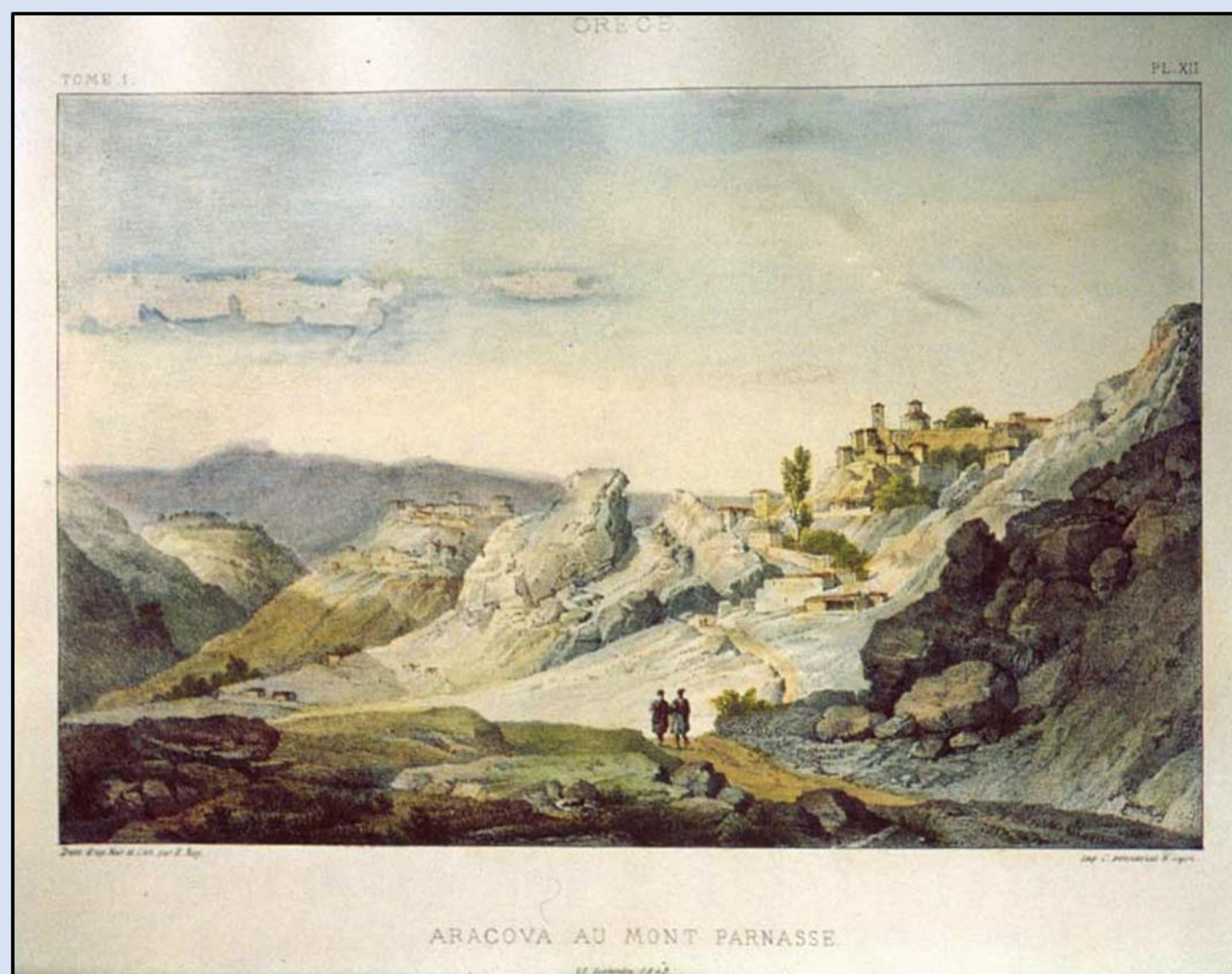
Εικόνα 12: Αράχωβα 1843 -E. REY