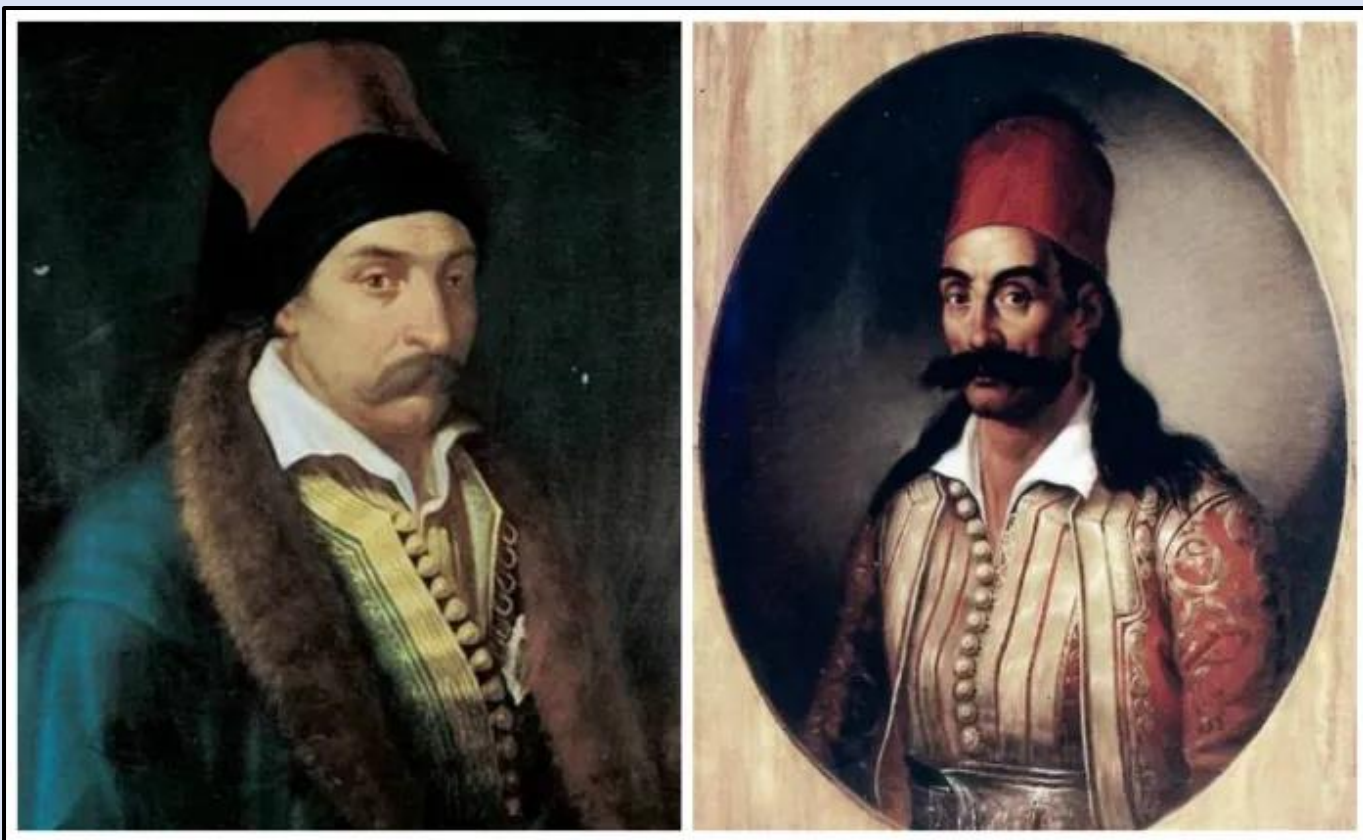
Εικόνα 2: Ο Ανδρέας Ζαΐμης (αριστερά) το 1826, μετά τα δραματικά γεγονότα του Μεσολογγίου, ανέλαβε την ευθύνη της διακυβέρνησης και της συνέχισης του Αγώνα. Παραμέρισε τις διαφορές του με τον Καραϊσκάκη (δεξιά) και του ανέθεσε την αρχιστρατηγία της Ρούμελης.

Στις 25 Οκτωβρίου, ο Καραϊσκάκης αναχώρησε για Ρούμελη με 3.000 άντρες από τους καλύτερους μαχητές που διέθετε η Ελλάδα, πολλοί από τους οποίους είχαν λάβει μέρος στην ηρωική έξοδο του Μεσολογγίου. Στις 27 Οκτωβρίου έφθασε στη Δομβραίνα, αλλά ύστερα από προδοσία οι Τούρκοι έμαθαν την παρουσία του στην περιοχή. Ο τουρκικός στρατός ενισχύθηκε με δυνάμεις από άλλες πόλεις και την αρχηγία ανέλαβε ο Αλβανός Μουσταφά Μπέη, που ήλθε από τη Λιβαδειά. Οι Τούρκοι ταμπουρώθηκαν στους πύργους του χωριού και οι μάχες που έδωσε εναντίον τους (27 και 28 Οκτωβρίου, 3 και 12 Νοεμβρίου) ήταν αμφίροπες. Ο Καραϊσκάκης έκρινε ότι οι πύργοι της Δομβραίνας δεν είχαν σπουδαία στρατηγική σημασία κι έχανε πολύτιμο χρόνο με την παράταση της πολιορκίας τους. Έτσι, αποφάσισε να κινηθεί νοτιότερα, και στις 17 Νοεμβρίου στρατοπέδευσε στο Δίστομο.