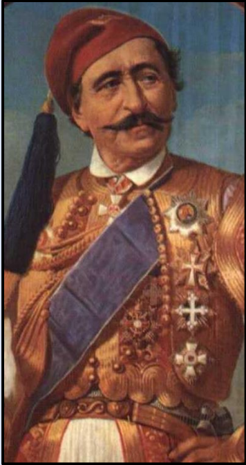
Εικόνα 5: Χατζηπέτρου (ή Χατζηπέτρος), Χριστόδουλος (Βετερνικό Τρικάλων, 1799 - Αθήνα, 1869). Φιλικός, οπλαρχηγός της Επανάστασης.

«χτυπά» απ' όλες τις μεριές. Ο κλοιός που σχημάτισε γύρω τους αποδείχτηκε ασφυκτικός.