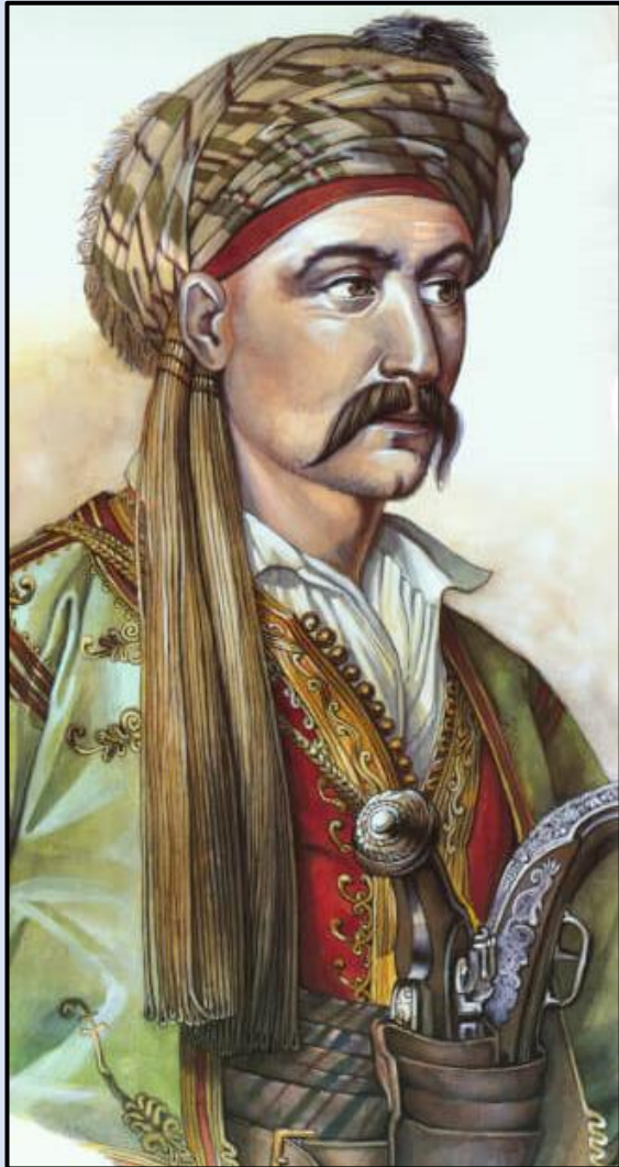
Εικόνα 10: Νικηταράς ο Τουρκοφάγος.

κυνηγούν και να τους σφάζουν με γιαταγάνια και μαχαίρια. Η καταδίωξη εξελίχθηκε σε σφαγή, που ολοκληρώθηκε τα μεσάνυχτα. Από τους Τούρκους διασώθηκαν μόνο 150, οι οποίοι βρήκαν καταφύγιο στη Μονή Ιερουσαλήμ. Οι φονευθέντες Τούρκοι εκείνη την ημέρα ήταν περίπου 600 ενώ πολλοί συνελήφθησαν. Αλλά και από αυτούς οι περισσότεροι πέθαναν από κρουπαγήματα. Οι συνολικές απώλειες στο ελληνικό στρατόπεδο ήταν συγκριτικά πολύ μικρότερες: λιγότεροι από 20 νεκροί και περίπου 50 τραυματίες. Οι Έλληνες κυρίευσαν 23 σημαίες, όλες τις αποσκευές και τα ζώα.