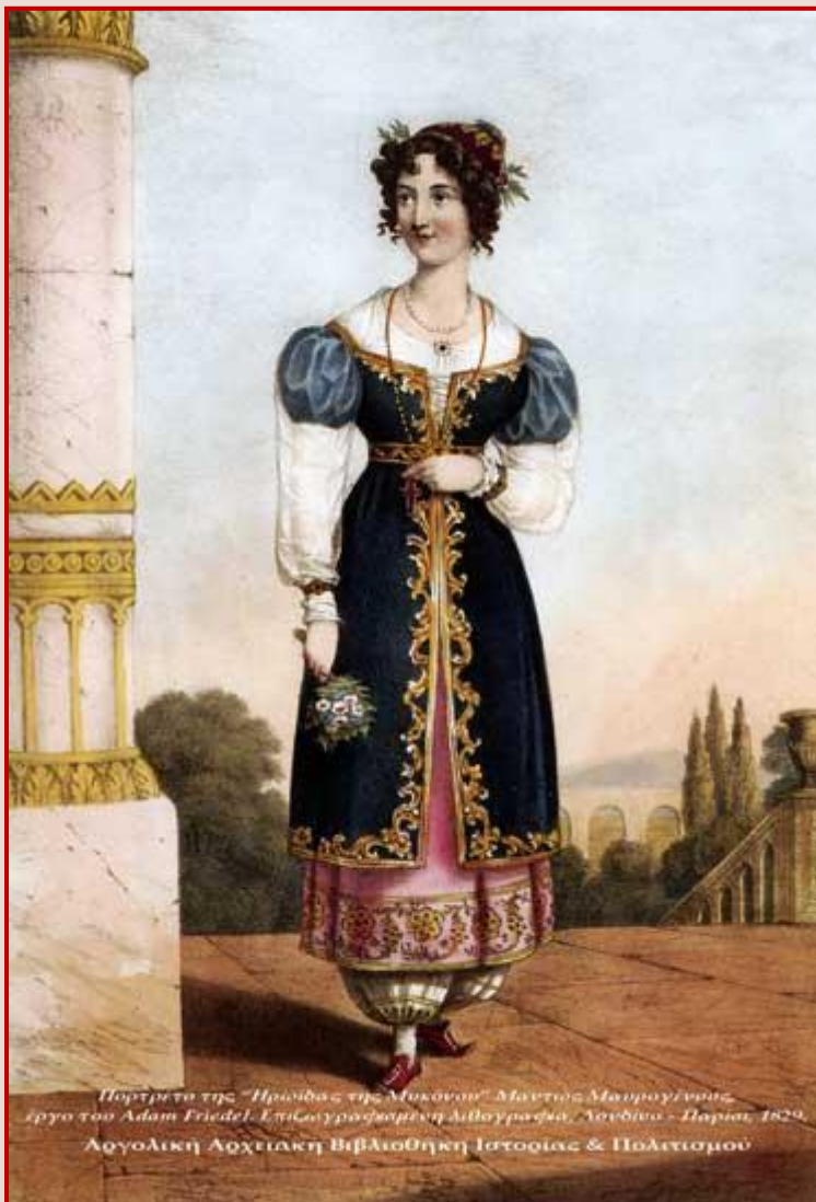
Εικόνα 2: Η Μαντώ Μαυρογένους, κόρη του Ηγεμόνα Νικολάου Μαυρογένη, ηρώίδα της Ελληνικής Επανάστασης από τη Μύκονο. Επιζωγραφισμένη λιθογραφία του Adam Friedel από το λεύκωμα "The Greeks. Twenty-four portraits of the principal leaders and personages who have made themselves most conspicuous in the Greek Revolution", Λονδίνο, 1829.

Κατά τη διάρκεια της Επανάστασης, η Μαντώ Μαυρογένους δραστηριοποιήθηκε κυρίως στη Μύκονο. Μετά από δική της προτροπή οι κάτοικοι του νησιού, ξεσηκώθηκαν εναντίον των Τούρκων. Η Μαυρογένους εξόπλισε πλοία από δικά της χρήματα και ηγήθηκε του αγώνα κατά των πειρατών που λυμαίνονταν τις Κυκλάδες και αργότερα πολέμησε στο Πήλιο, στη Φθιώτιδα και στη Λιβαδειά. Επίσης συνέβαλε με 50 άντρες στην Άλωση της Τριπολιτσάς. Δημιούργησε στόλο 6 πλοίων και πεζικό από 16 λόχους με 50 άντρες ο κάθε ένας. Έλαβε μέρος σε επιχειρήσεις στην Κάρυστο το 1822. Χρηματοδότησε την εκστρατεία της Χίου, όμως δεν κατάφερε να εμποδίσει τη σφαγή της Χίου. Όταν ο Οθωμανικός στρατός έκανε την εμφάνισή του στις Κυκλάδες, πούλησε τα κοσμήματά της για τη χρηματοδότηση εφοδιασμού και εξοπλισμού 200 ανδρών, οι οποίοι πολέμησαν τον εχθρό και περιέθαλψε 2.000 ανθρώπους που είχαν επιβιώσει από την 1 η πολιορκία του Μεσολογγίου.