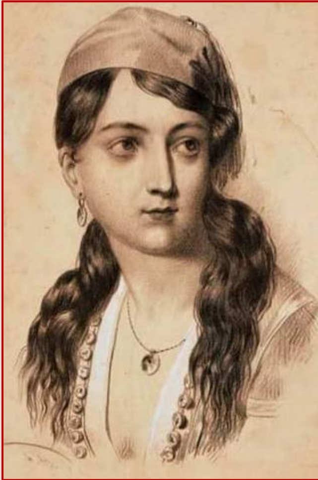
Εικόνα 3: Θεόδωρος Βρυζάκης, «Μαντώ Μαυρογένους», μολύβι σε χαρτί 20,5×13,5 εκ., Συλλογή Βασιλείου Στεφανή.

Τον Μάιο του 1823 το σπίτι της κήκε ολοσχερώς και η περιουσία της εκλάπη. Το 1825 κατέληξε να ζει σε ένα μισοερειπωμένο σπίτι. Η αθέτηση υπόσχεσης γάμου από τον Υψηλάντη, η φτώχεια στην οποία είχε περιέλθει και η βίαιη απομάκρυνσή της το 1826 από το Ναύπλιο με εντολή του Ιωάννη Κωλέττη, υπήρξαν βαρύτατα πλήγματα για την ηρωίδα.