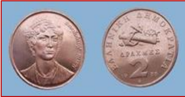
Εικόνα 4: Η Μαυρογένη απεικονίστηκε στο κέρμα των 2 δραχμών (1988-2001).

Μαντώ Μαυρογένους, σε γράμμα της προς τις ευρωπαϊκές αυλές: