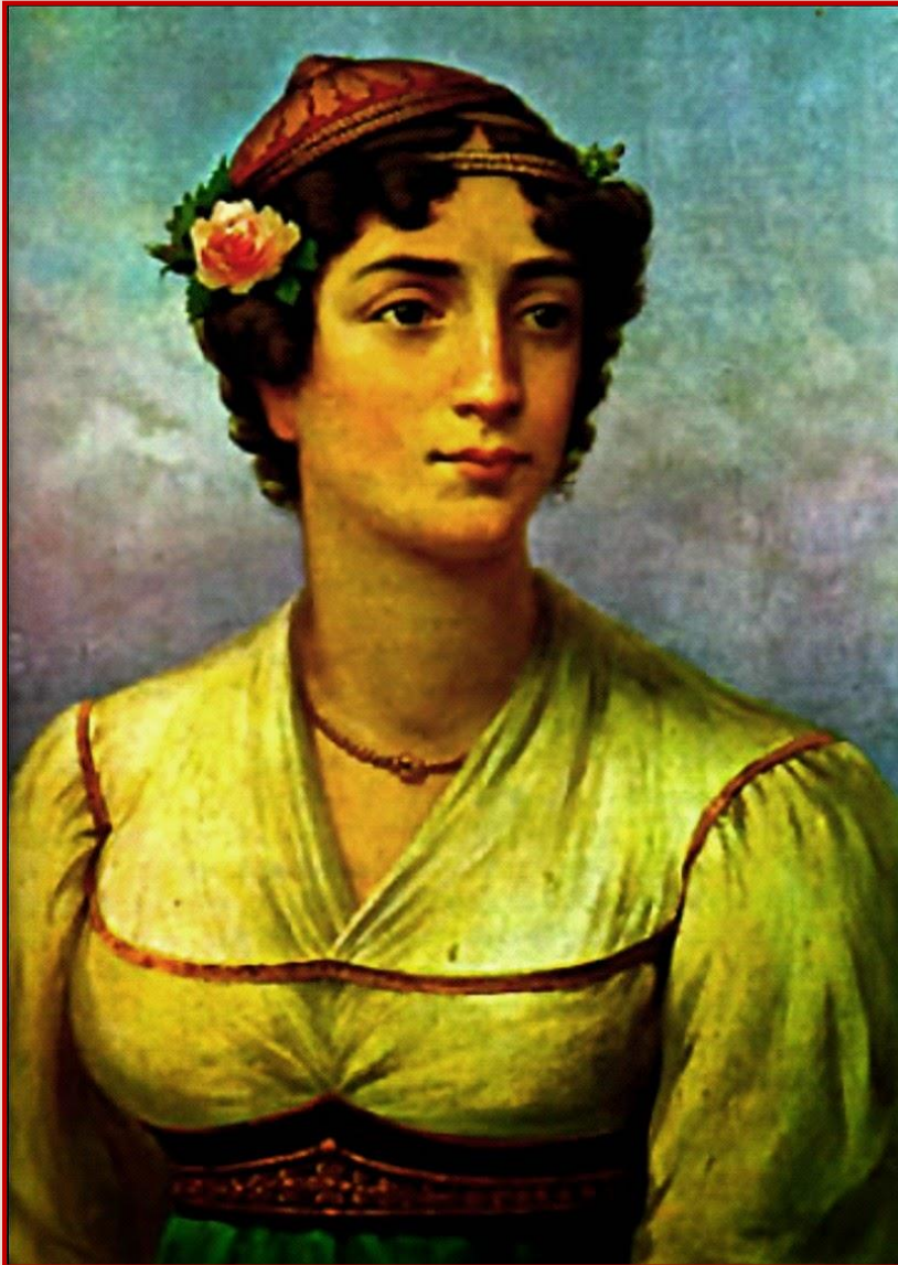
Εικόνα 5: Η Μαντώ Μαυρογένους, λιθογραφία του Adam Friedel, 1827