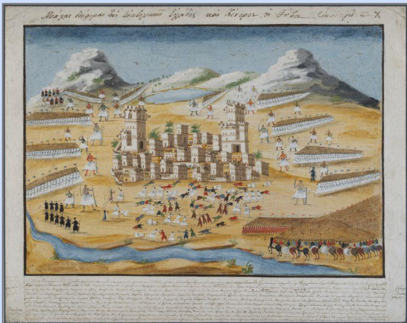
Εικόνα 4: «Μάχαι διάφοραι της Ανατολικής Ελλάδος και κέντρον η Θήβα», πίνακας των Π. και Δ. Ζωγράφου

Ο Ασλάν μπέης, κατάλαβε ότι δεν είχε νόημα να συνεχίσει τη μάχη. Έπρεπε να φτάσει στη Λάρισα όσο πιο γρήγορα γινόταν και χωρίς άλλες απώλειες. Έτσι αποφάσισε να διαπραγματευτεί με τον Υψηλάντη για να μπορέσει να περάσει από την περιοχή. Οι Έλληνες δέχθηκαν, υπό τον όρο να παραδώσουν την περιοχή από τη Λιβαδιά ως τις Θερμοπύλες και την Αλαμάνα. Οι Τούρκοι θα παραχωρούσαν όλη την Ανατολική Στερεά Ελλάδα, εκτός από την Αθήνα και τη Χαλκίδα. Οι Έλληνες, από την πλευρά τους, ανέλαβαν την υποχρέωση να αφήσουν τον εχθρό να διέλθει