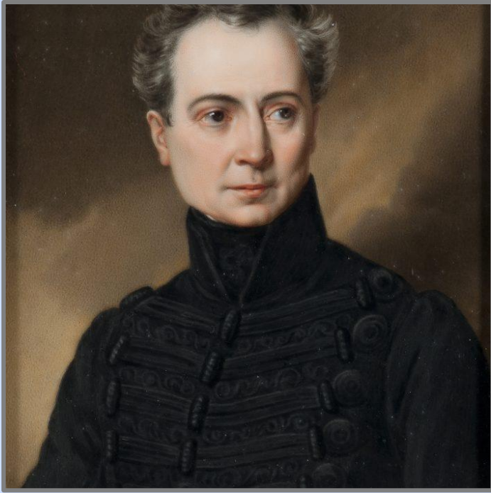
Εικόνα 9: Αυγουστίνος Καποδίστριας