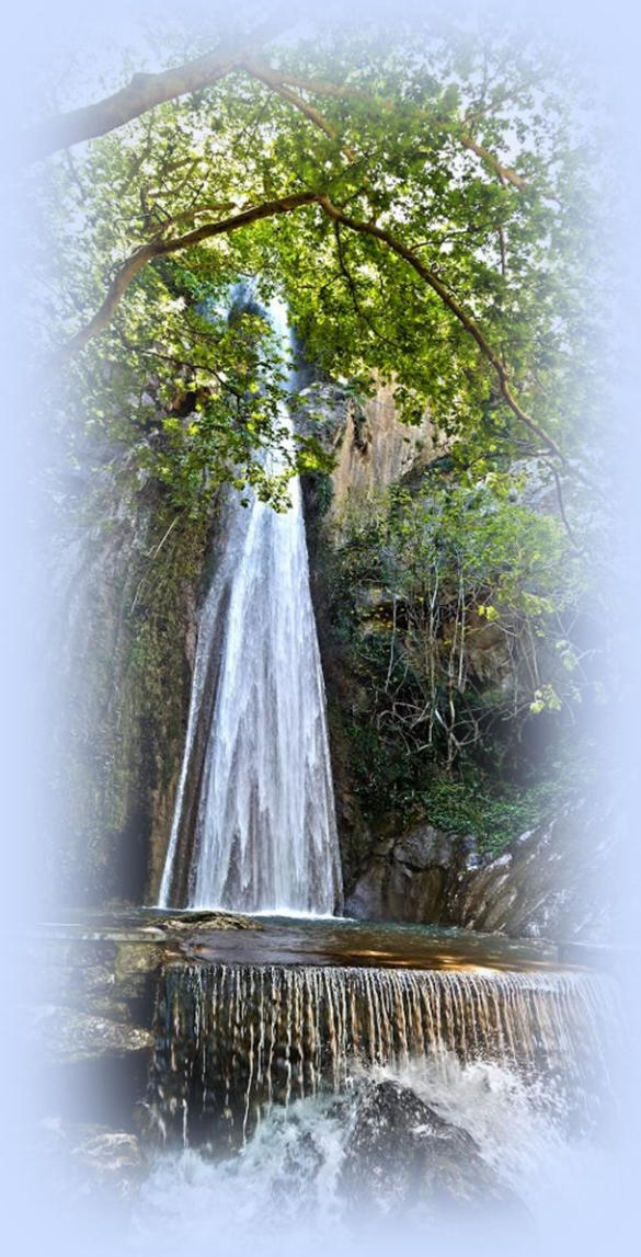
Εικόνα 13: Καταράκτες της Πέτρας Βοιωτίας