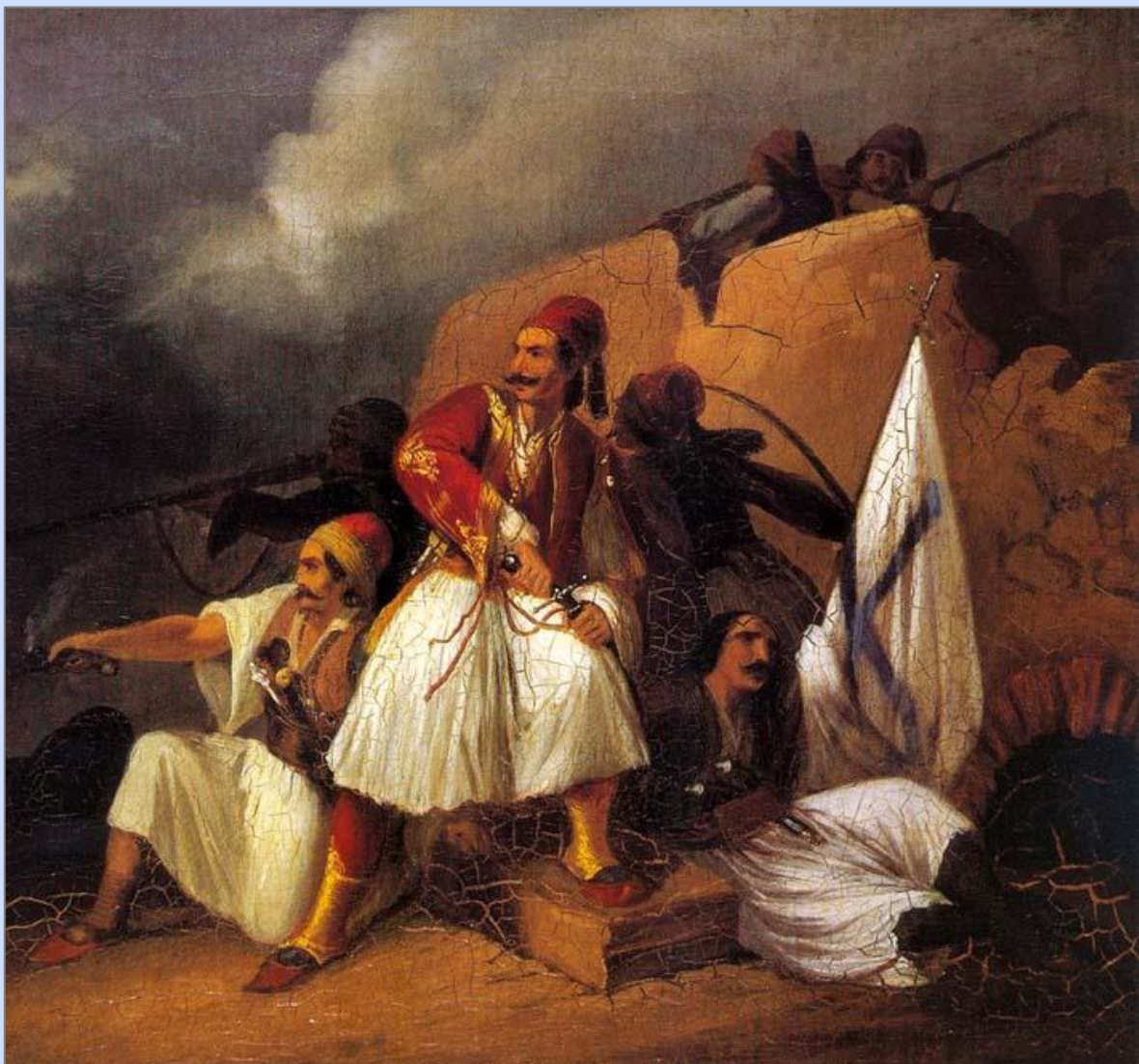
Εικόνα 10: Θ. Βρυζάκης, Πολεμική Σκηνή. 1853. Εθνική Πινακοθήκη. Αθήνα