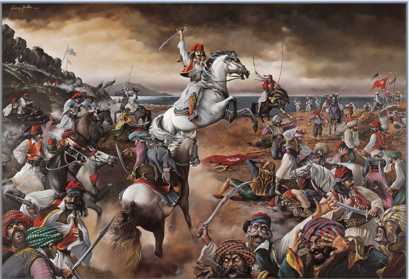
Εικόνα 11: Γιάννη Νίκου: «Ο Νικόλαος Κριεζώτης στη Μάχη στο Βατίτσι» 300x 200 cm ελαιογραφία, 2001.

Τον Ιούνιο εκείνης της χρονιάς, ο Κριεζώτης μπήκε με τη μονάδα του στη Βοιωτία, σε περιοχή που ήλεγχαν οι Τούρκοι και μακριά από τις ελληνικές γραμμές. Κοντά στην Αυλίδα έφτιαξε στρατόπεδο απ' όπου σκόπευε να χτυπήσει στη Χαλκίδα τον παλιό του εχθρό, Ομέρ Μπέη. Όμως αυτός επιτέθηκε πρώτος και στη μάχη που ακολούθησε ηττήθηκε από τους Έλληνες.