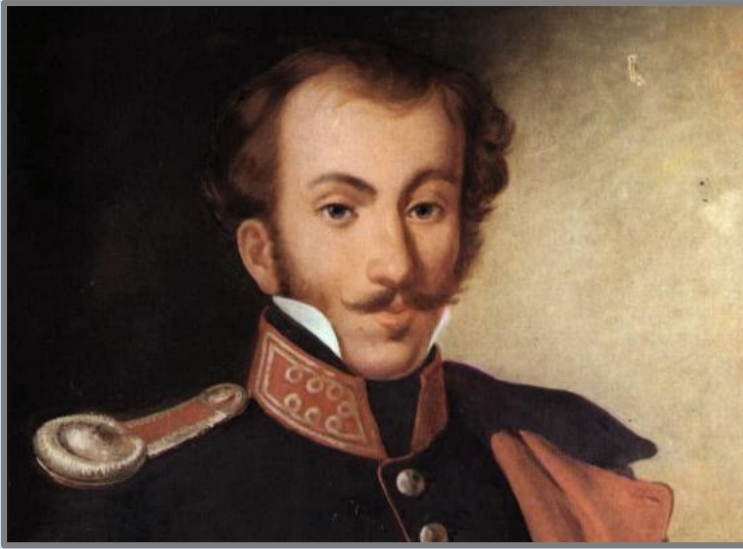
Εικόνα 1: Δημήτριος Υψηλάντης

του Αγίου Νικολάου πάνω από τα στενά της Πέτρας, απ' όπου θα περνούσαν υποχρεωτικά οι Τούρκοι κατά την επιστροφή τους από την Αθήνα. Η Πέτρα, βρίσκεται μεταξύ Θήβας και Λιβαδειάς και ήταν η καταλληλότερη τοποθεσία για την αντιμετώπιση των Τούρκων. Πριν την αποξήρανση της Κωπαϊδας, τα νερά της λίμνης έφθαναν ως τον βράχο (γι' αυτό και ονομαζόταν Πέτρα) και άφηναν μόνο ένα στενό