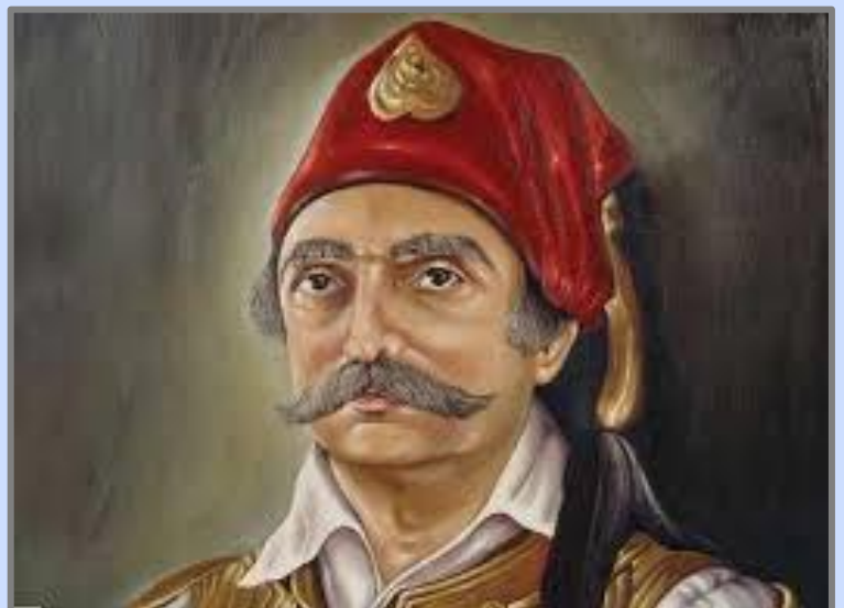
Εικόνα 2: Νικόλαος Κασομούλης

Μετά από μια εκνευριστική αναμονή 12 ημερών, το απόγευμα της 10ης Σεπτεμβρίου, φάνηκε να πλησιάζει προς την Πέτρα ο τουρκικός στρατός, με επικεφαλής τον Οσμάναγα Ουτσιάκαγα, αρχηγό των τακτικών στρατευμάτων της Αττικής και τον Ασλάν μπέη. Όπως γράφει ο Κασομούλης: