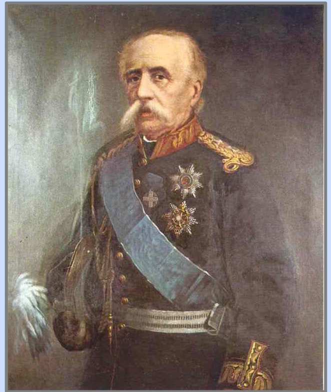
Εικόνα 8: Σπυρίδων Μήλιος ή Σπυρομήλιος

10 βήματα έξω του προμαχώνος (εννοεί του προμαχώνα του Γ. Σκουρτανιώτη). Εισ την στιγμήν έτρεξαν βοηθοί οι χιλίαρχοι Δυοβουνιώτης και Κριεζώτης με το περισσότερο μέρος των Στρατιωτών τους, και επέπεσον εναντίον τούτων όπου έκαναν την έφοδόν των, οδηγούμενοι από τον Ασλάν Μπέη. Από τούτο και την γενναίαν ανθίστασην του προμαχώνος, εματαιώθη η έφοδος, εκυνηγήθησαν οι Αλβανοί και μετά δύωρον ακόμη μάχην, υποχρεώθησαν όλοι οι Τούρκοι ν' αφήσωσι τας θέσεις των, φεύγοντας μεταξύ του αδιακόπου και πυκνού πυροβολισμού των Ελλήνων. Εισ την ιδίαν στιγμήν επέπεσεν ο αρχηγός της φρουράς Σ. Μήλιος (εννοεί τον Σπυρομήλιο) κατά της δυνάμεως των Βρασταμητών και την απέδιωξεν ζημιουμένην.